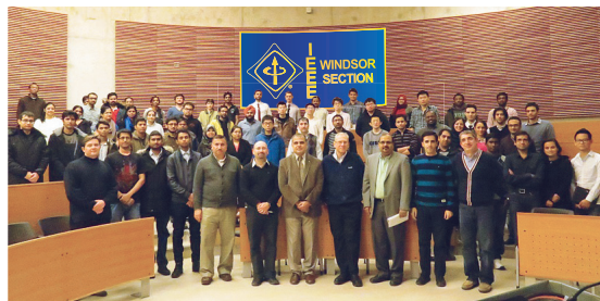
IEEE Windsor Section inaugural meeting, February 5, 2015.

À tous les membres qui ont fait de ces deux années une des expériences les plus gratifiantes de ma vie, une dernière fois, merci! ■